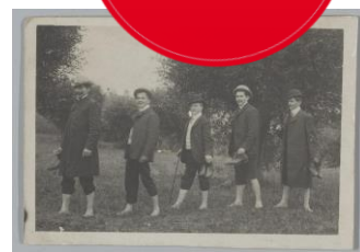
Dauwtrappen door een groepje Amsterdamse effectenhandelaren in 1911